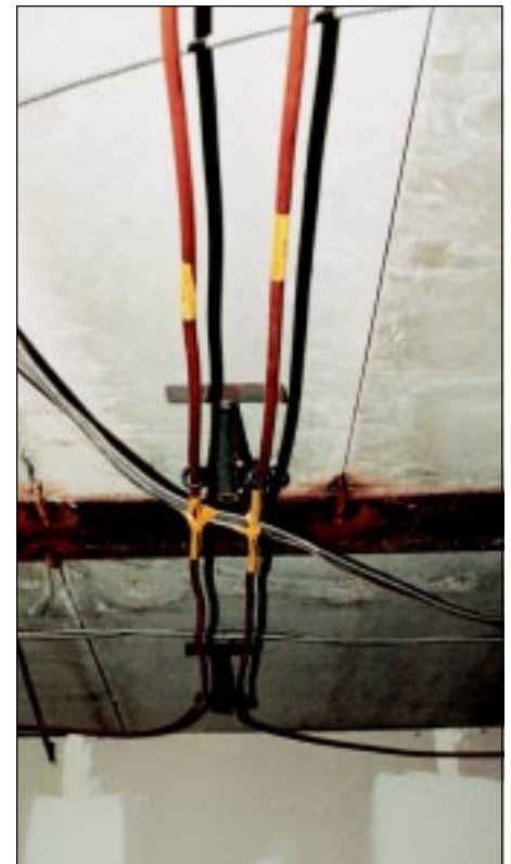
A clever bracket system made installation of the copper tube easier in the corridors.