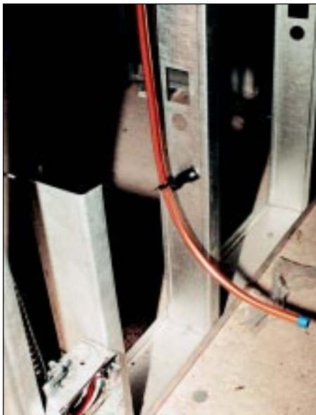
On a laissé un tube de cuivre prêt à servir, à l'emplacement d'une sècheuse à linge.

Les nouveaux propriétaires ont pour la plupart choisi de faire aménager un foyer directement ventilé au gaz naturel. Pour ceux qui n'ont pas choisi cette option, on a laissé un tube de cuivre prêt à servir au cas où ils décideraient de faire poser cet appareil plus tard, ou bien si les futurs propriétaires en désireraient un. La pose d'avance des conduites supplémentaires de cuivre s'accroît en popularité en raison des possibilités d'ajout, à une date ultérieure, d'autres appareils ménagers et équipements. En