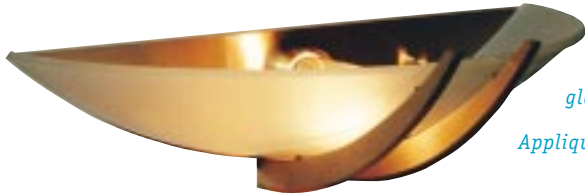
A finished wall sconce of bronze and glass.

Applique murale finie en bronze et en verre.