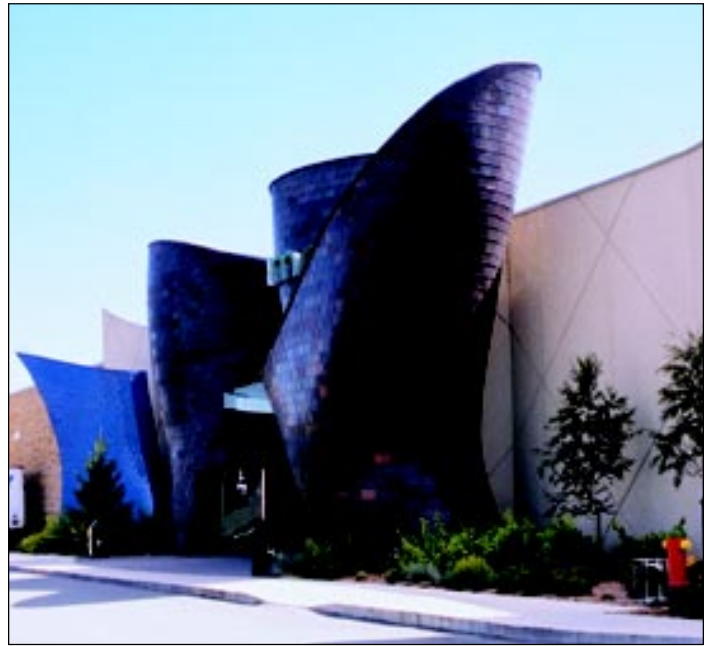
The dramatic entrance contrasts with the rest of the mall's architecture.

La Maison Simons chain of fashion department stores, established in 1889 and based in Quebec City, undertook a recent expansion into other Quebec locations. Their new store in Sherbrooke is one of six across the province. It features an expressive, copper-clad façade at the entrance, consisting of a series of organic shapes that appear to grow out of the ground. The shapes are clad in small 16-oz. copper squares, giving the appearance of scales. Because of the various curves of the structure, they reflect light and create colours that vary over the exterior of the store.