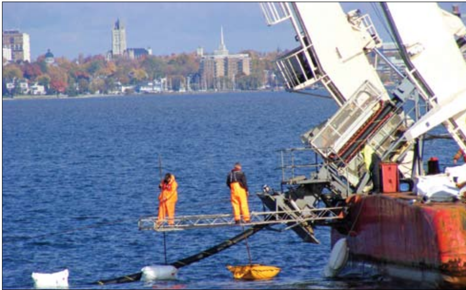
The cable-laying operation was completed late in 2008.

Prepared from information provided by Nexans Canada Inc., and Canadian Hydro Developers Inc., their assistance is sincerely appreciated.