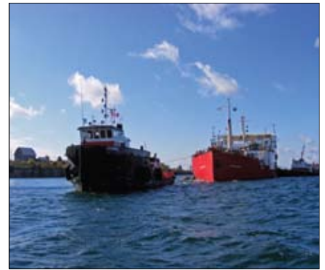
La barge câblière C/B Henry P. Lading étant tirée par le remorqueur Lucas.

Le câble a été transporté à l'île Wolfe à bord du C/B Henry P. Lading, une barge câblière spéciale qui a été tirée sur l'Océan atlantique par le remorqueur Lucas. Le voyage a duré environ 22 jours, avec des arrêts à Québec, Montréal et Prescott, pour préparer le parcours final sur la Voie