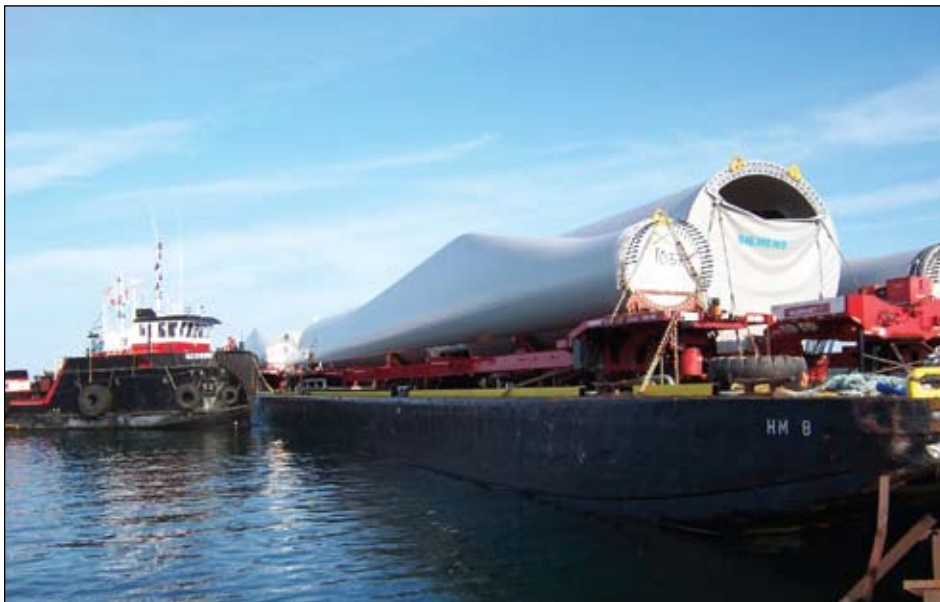
Sections d'une éolienne arrivant par barge.

The C/B Henry P. Lading cable-laying barge, towed by the tug boat Lucas.