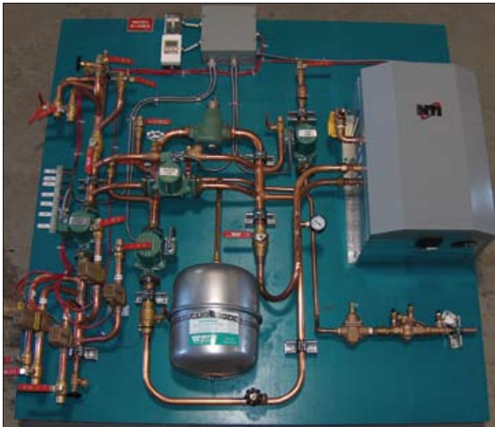
Panels are fabricated for all sizes of residential and commercial hydronic heating systems.

Fabrication d'un panneau de distribution primaire destiné à servir dans un projet de restauration d'un immeuble en copropriété.