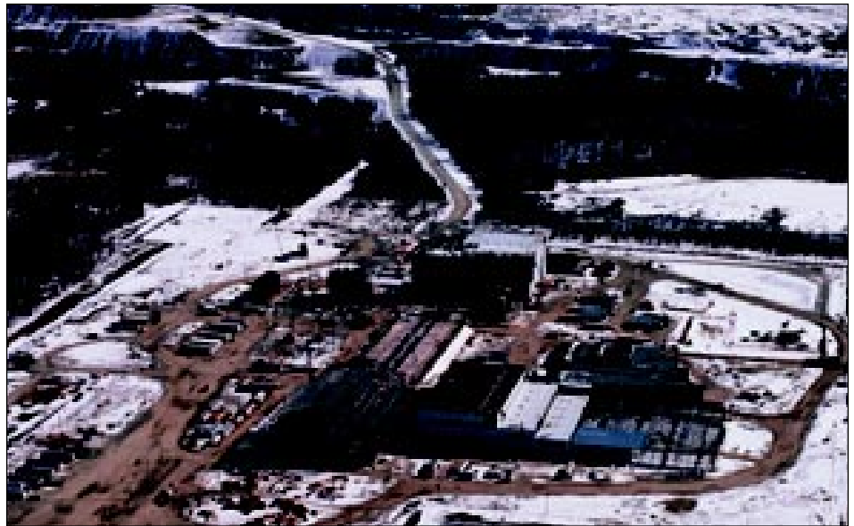
Vue aérienne de la construction à l'usine de Magnola.

Les nouveaux procédés de lixiviation, de déshydratation et de chloration à l'état fondu, mis au point au Centre de