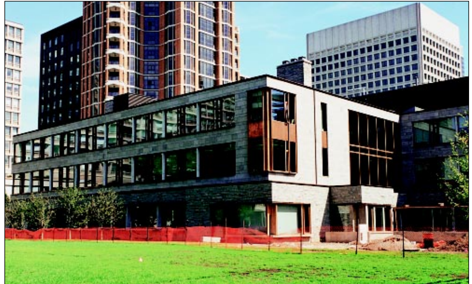
Nouveau siège social de la société McKinsey and Company.

On devait répondre aux besoins d'espace d'une société internationale et construire un bâtiment dont le caractère traduirait la permanence et la polyvalence d'un édifice universitaire. Pour ce faire, on a fait appel aux services d'un cabinet d'architectes torontois, la société Taylor Hariri Pontarini Architects, sous la supervision de l'architecte Siamak Hariri, et à l'entreprise de construction, Vanbots Construction Corporation de Markham, en Ontario. Ces deux