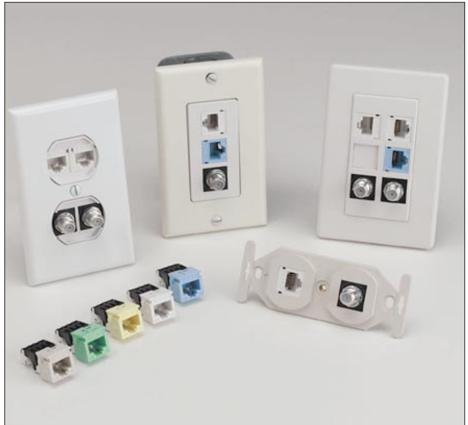
Les prises de courant du système de câblage RUN sont disponibles sous formes diverses.

Les câbles à haute technologie du système RUN sont conformes à des normes rigoureuses de contrôle de qualité. Ils sont composés de conducteurs résistants en cuivre. Le câble SUPER RUN 100 est un câble non blindé (UTP) à haut rendement de catégorie 5, constitué de quatre paires de conducteurs en cuivre grosseur 24 AWG permettant la transmission de voix-données à une vitesse pouvant atteindre 100 mégaoctets/seconde. Le câble coaxial SATELLITE RUN de série 6 (RG-6U) se compose d'un seul conducteur en cuivre