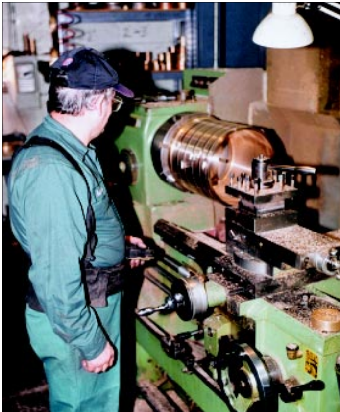
Machining a large bearing at K.P. Bronze.

Les coussinets en alliages de cuivre sont disponibles sous différentes formes et dimensions.