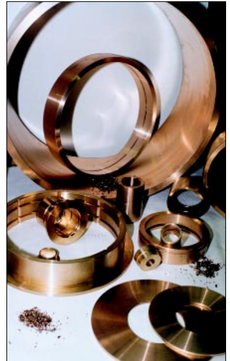
Copper alloy bearings are available in a variety of sizes and designs.

In the centrifugal casting process, the molten metal is forced against the side of